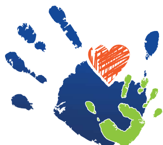
Table des partenaires Petite Enfance - Famille 0 - 5 ans de la MRC d'Acton