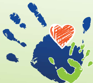
Table des partenaires Petite Enfance - Famille 0 - 5 ans de la MRC d'Acton